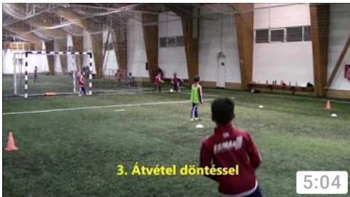
3. Átvétel döntéssel

labdakoordinációs gyakorlatok amelyek fejlesztik a labdaérezket, és bemelegítésnél is alkalmazható. A