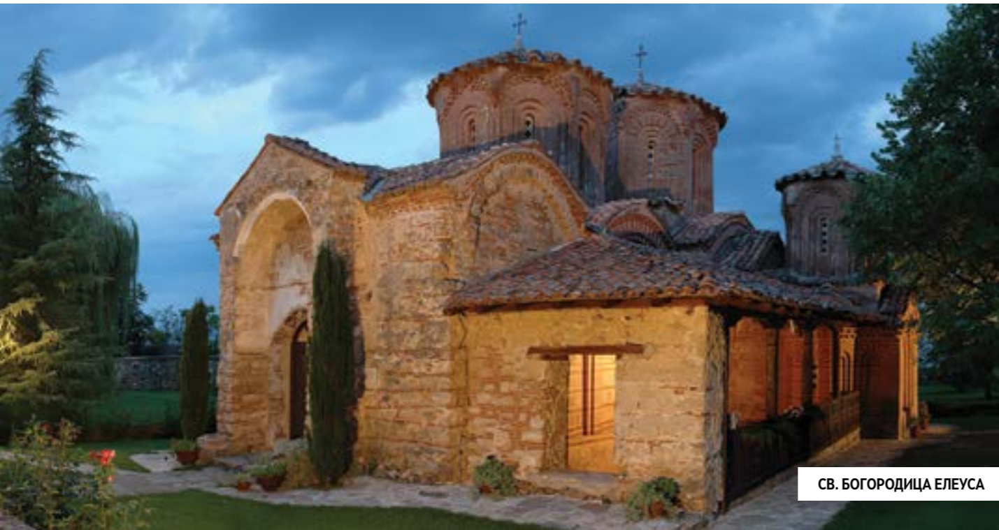
СВ. БОГОРОДИЦА ЕЛЕУСА

Веспазијан (69-79) поради прифаќање на христијанството. Од фрескоживописот на оваа црква се зачувани фрески со претстави на шест Архиеереи и фреската на Св. 40 севастиски маченици. Во самиот комплекс се истражени две манастирски бањи, конак со стопански придружни објекти и богата средновековна некропола со над 1000 гробови од XIII се до XX век. Црквата во XIII век била срушена по што била напуштена и во нејзина близина тогаш никнала богата средновековна некропола. Врз остатоците на темелите од поранешните цркви е извршена реставрацијата во 1979 год. и денес е јасно забележливо по оловната преграда до каде биле остатоците. Во 1996 год. овде е обновено монаштвото, а денес овде живеат монашкото сестринство на струмичката епархија.