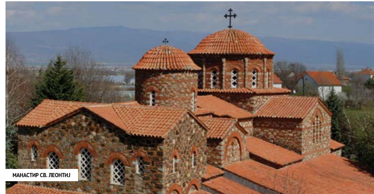
МОНАСТИР СВ. ЛЕОНИЈ

1348-1352 год. со кој се подарува на манастирот „Св. Архангел Михаил и Гаврил“ кај Призрен. Во османлискиот период храмот бил разрушен, за да во 1921 год. култот бил обновен преку подигнување на една мала капела. Во 1972 год. при копањето на темелите за изградба на нова црква, се пронајдени темелите на старите храмови. Во 1974 год. била завршена новата црква која е еднокуполна и еднакорабна, а во 1976 год. бил поставен и дрвениот иконостас. Во склоп на комплексот се наоѓа конач од отворен тип.