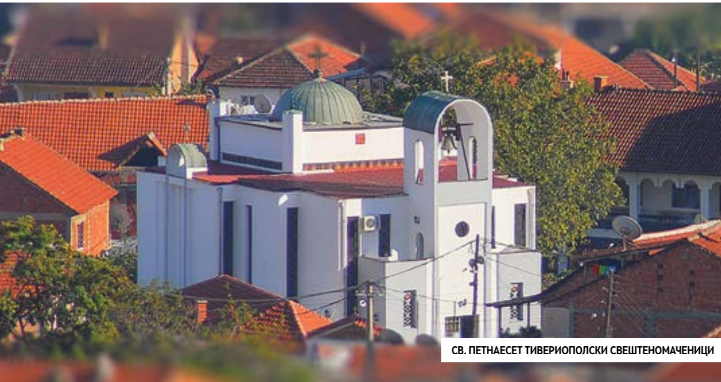
СВ. ПЕТНАЕСЕТ ТИВЕРИОПОЛСКИ СВЕШТЕНОМАЧЕНИЦИ

како склад за жито, вино, вода и др. Во рамките на тврдината се наоѓаат остатоци од стопански и станбени објекти. Јужно од тврдината се наоѓа некропола поврзана со посадата на тврдината, која се употребувала од I век п.н.е. од кога се смета дека потекнувала тврдината, па се до турскиот период. До XV век во тврдината имало посада, но поради стабилизацијата на приликите во османлиското царство веќе во времето на Евлија Челебија (1670 год.) тврдината е напуштена и запустена. Континуитетот на живеење на овој доминантен рид потекнува од четвртиот милениум п.н.е. кога на овие простори се развивала богата енеолитска и ранобронзена култура.