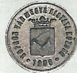
Helytörténeti Gyűjtemény Soproni Múzeum