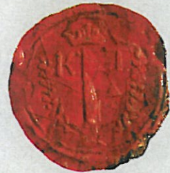
Urbarialia, felülvizsgálati iratok Községi Pecsétek Gyűjteménye GyMSMSL