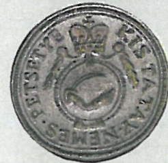
Helytörténeti Gyűjtemény Soproni Múzeum