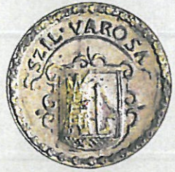
Helytörténeti Gyűjtemény Soproni Múzeum