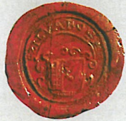
Községi Pecsétek Gyűjteménye GyMSMSL