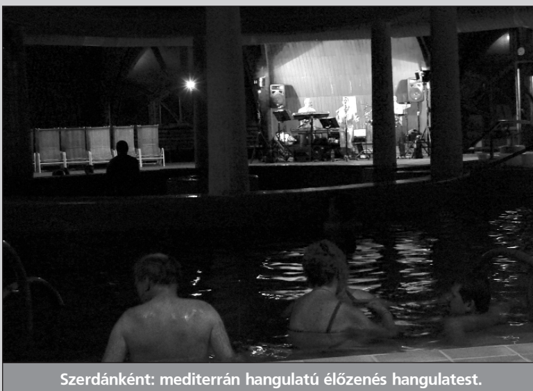
Szerdánként: mediterrán hangulatú élőzenés hangulatest.