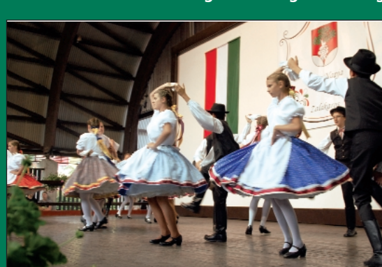
A Zöld Ág Táncgyűttes bemutatója.

nalas fellépése hatalmas ovációt váltott ki. Bizony, az elismerést kétszeresen is megérdemelték. Az immár megszokott magas színvonalú műsorral örvendeztette meg a közönséget a Zöld Ág Táncgyűttes is.