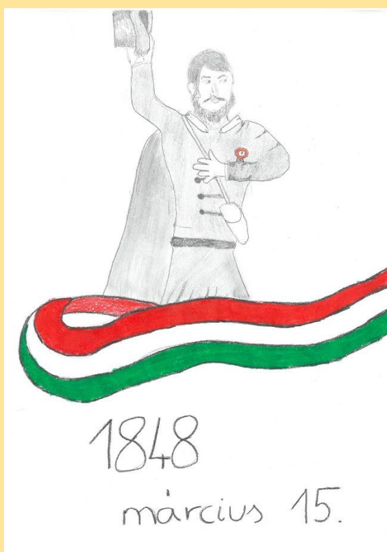
Zsilko Máté (6.a)