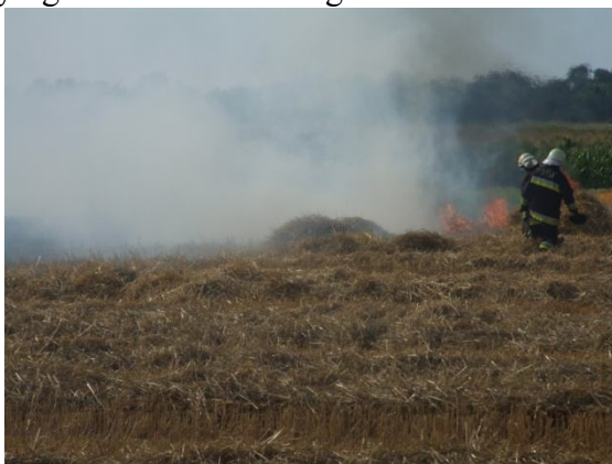
A tűzoltása kéziszerszámokkal

2010. július 31.-én Mihályi és Gyórá között renden lévő szalma égett. A kikerkező kapuvári egységek a tüzet 2 "D" sugárral és kéziszerszámokkal eloltották