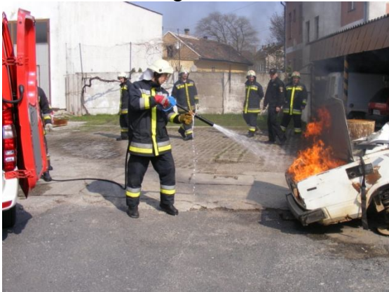
Kigyulladt csomagtartó oltása