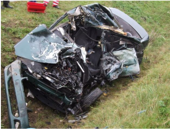
A személyautó roncsai

2010. október 20-án a kora délutáni órákban a 85-ös főút hegykői leágazójához riasztották a kapuvári és a soproni egységeket, ahol egy teherautó és egy személygépjármű ütközött. A baleset következtében a gépkocsi vezetője a gépjárműbe szorult. Őt az egységek feszítő-vágó berendezés segítségével emelték ki a járműből. A helyszínen életét veszítette.