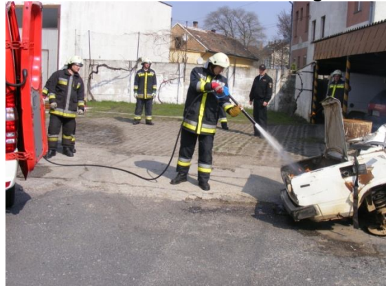
A tűz eloltása