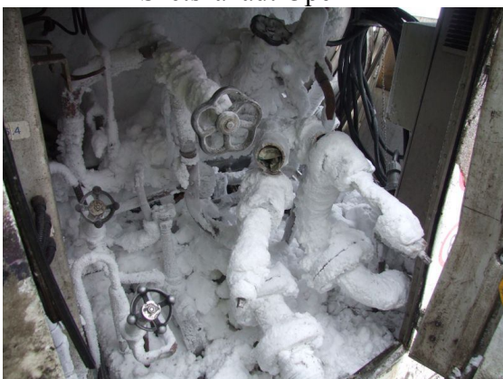
A lefagyott nitrogén csomkok