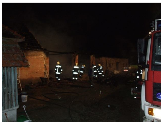
Az égett maradványok kihordása