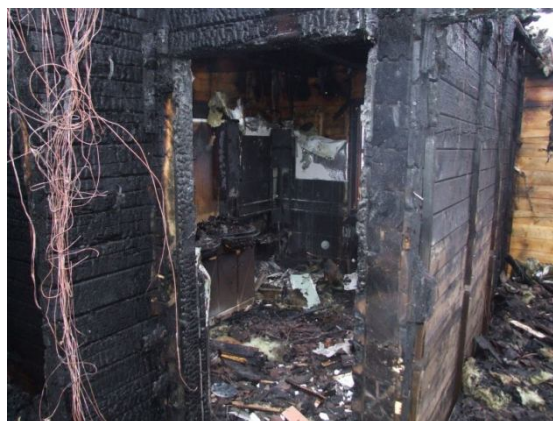
Megégett ház rész