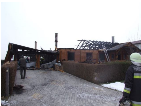
A megmaradt épület