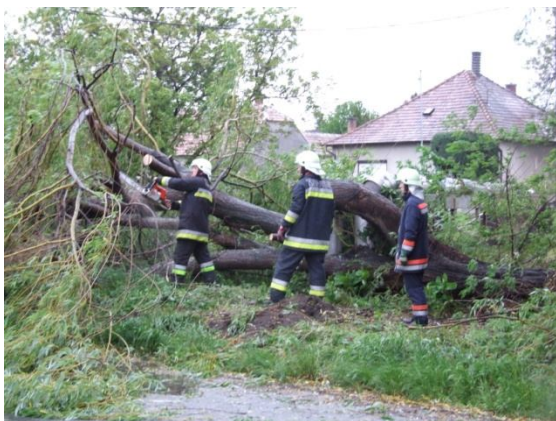
Közút felszabadítása Kapuváron