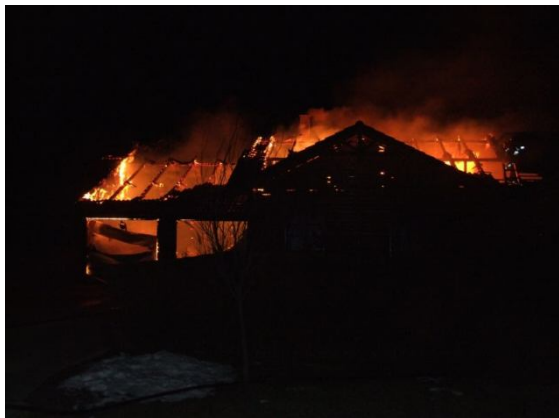
A kiérkezés pillanata

2010. december 15-én az éjszakai órákban Vitnyédre riasztották a kapuvári, csornai és soproni tűzoltókat, ahol egy gerendaház lángolt. A kiérkező egységek a tüzet 4 "D" sugárral és kéziszerszámokkal eloltották. Az épület tetőszerkezete szinte teljesen, az épület több mint a fele vált a tűz martalékává. Az utómunkálatok a déli órákig tartottak.