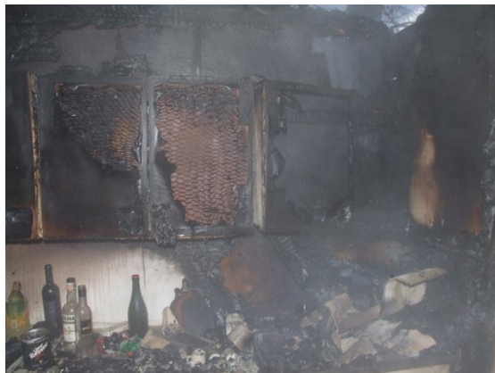
A konyha maradványai