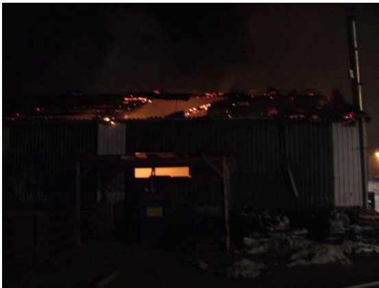
a tető beszakadása

2010. január 21.-én éjjel egy óra után érkezett a jelzés a kapuvári tűzoltóságra, hogy Fertőszentmiklós határában füstöt és lángokat látnak. Az egység kiérkezésekor derült ki, hogy a fertőszentmiklói Hungaropro Kft egyik csarnoka ég, így a fokozatot a legmagasabb V. K-re módosították. A csarnokban fűrészáru égett, a tűz átterjedt a tető szigetelésére és az oldalfalra is. A nagy erővel, mintegy 12 gépjárművel a helyszínre érkező megyei és Vas megyei egységek a tüzet mintegy másfél órán belül 5 "C" sugárral és kéziszerszámokkal megfékeztek és eloltották. Az utómunkálatok a reggeli órákig tartottak.