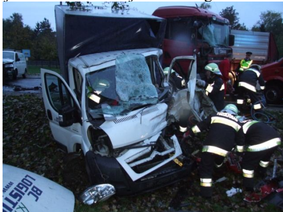
A még elő személy kiszabadítása

A transporterben utazó három fő az egység kiérkezésére kiszállt a gépjárműből, őket a mentők ellátták majd kórházba szállították. A kisteher vezetőjét az egység feszítő-vágó segítségével mentette ki a gépjárműből, Ő a helyszínen elhalálozott. A gépjárművek áramtalanítását az egység elvégezte, majd a rendőrségi helyszínelés után a kiömlött olajat perlittel felitatta, az úttestet 1 "D" sugárral lemosatta. A műszaki mentés és a helyszínelés idejére a 85-ös utat teljes szélességében lezárták.