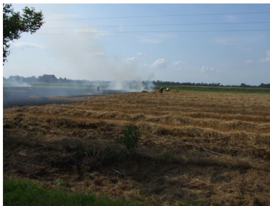
A tűz körülhatárolva