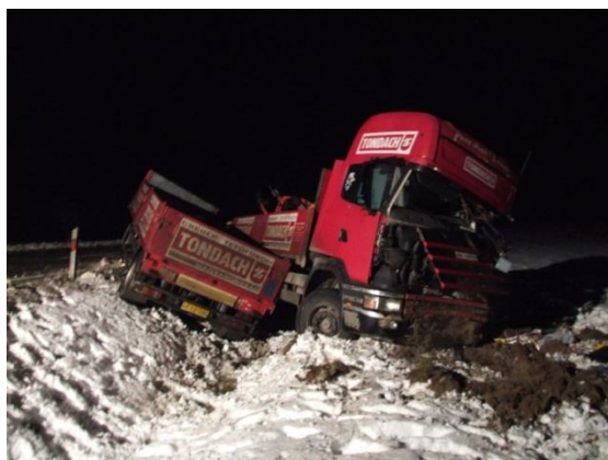
A szétroncsolódott tehergépkocsi