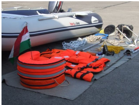
A kapott felszerelések