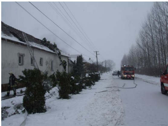
A családi ház és a melléképület

2010. december 1-én a reggeli órákban Kapuvárra a Pacsirta utca és Mátyás utca kereszteződésébe riasztották a kapuvári és csornai tűzoltókat, ahol egy kazánház és a mellette lévő családi ház tetőszerkezetének egy jelentős része égett. A kiérkező egységek a tüzet 5 "D" sugárral és kéziszerszámokkal eloltották, az épületből 2 db PB gázpalackot kimentettek. Az egyik kapuvári tűzoltót 8 napon túl gyógyuló sérülésekkel a soproni kórházba szállították a mentők