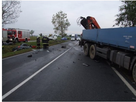
Az ütközés helyszíne