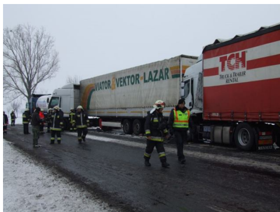
3 kamion balesete