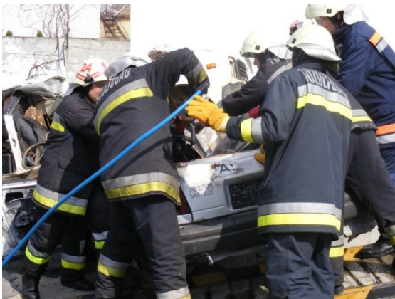
Feszítő - vágóval beavatkozás