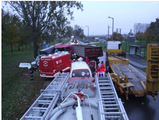
A helyszín fentről