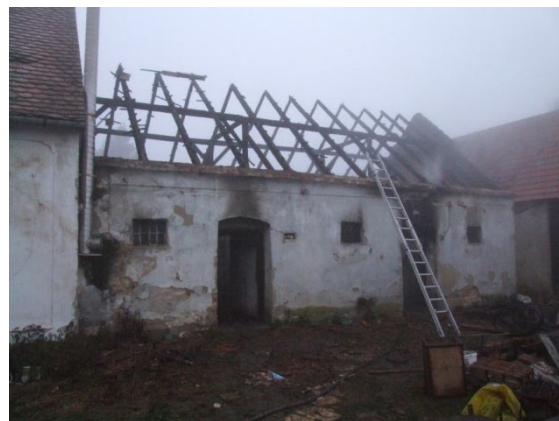
A leégett melléképület maradványai