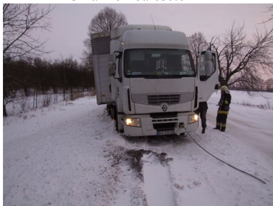
kamion elakadt a hóban