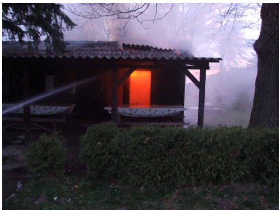
A kiérkezés pillanata

2010. április 9-én a hajnali órákban Göbösmajorba riasztották a kapuvári és csornai egységeket, ahol egy faház égett. A kiérkező egységek 2 "D" sugárral és kéziszerszámokkal mintegy tíz percen belül a kb. 40 négyzetméteres faházat eloltották.