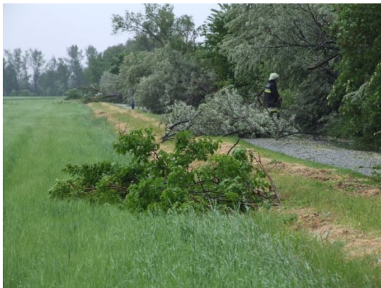
Fáktól lezárt bekötő út Fertődön

Május hónapba többször és több helyszínre is riasztották a kapuvári egységeket kidőlt fákhöz, amelyek forgalmi akadályt képeztek, vagy veszélyeztették a közlekedők biztonságát. Az egységek motoros láncfűrész segítségével a forgalmi akadályokat és a veszélyhelyzeteket megszüntették.