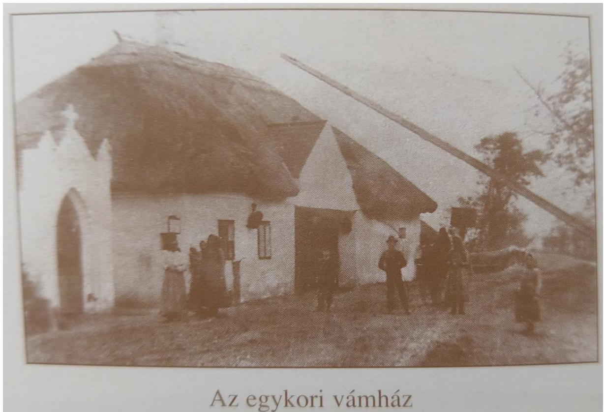
Az egykori vámház