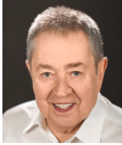
BÁLINT PÉTER színművész