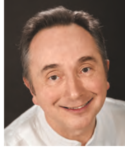
BELLUS ATTILA színművész