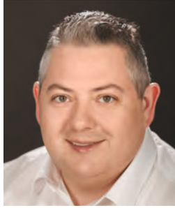
FARKAS GERGŐ színművész