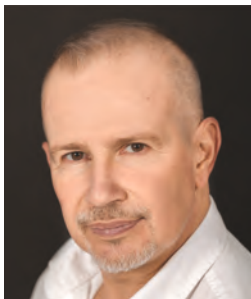
HERTELENDY ATTILA színművész