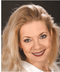
DEBREI ZSUZSANNA színművész