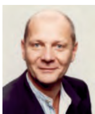
BEREMÉNYI GÉZA Kossuth-díjas író, rendező Örökös tag