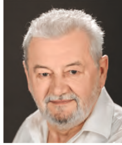
FARKAS IGNÁC Jászai-díjas színművész Örökös tag