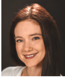
KOVÁTS DÓRA színművész