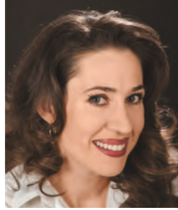
MAGYAR CECÍLIA színművész