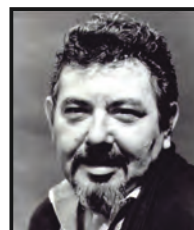
†RUSZT JÓZSEF színházalapító Kossuth-díjas rendező, Örökös tag