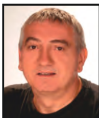
†GYÖRGY JÁNOS Aase-díjas színművész, Örökös tag