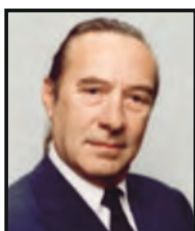
†BALOGH TAMÁS színművész, Örökös tag