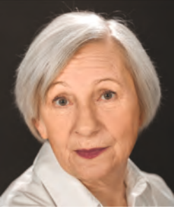
ECSEDI ERZSÉBET Aase-díjas színművész Örökös tag