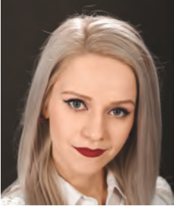
KOVÁCS VIRÁG színművész