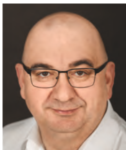
KISS ERNŐ Jászai-díjas színművész