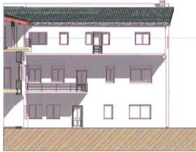
UDVARI DÉLI HOMLOKZAT M=1:100