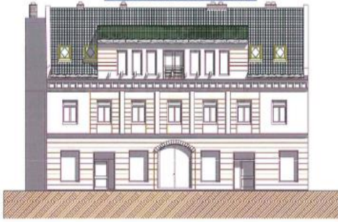
KELETI HOMLOKZAT M=1:100