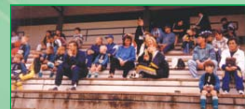
Kitartó szülők Ausztriában – nélkülük nehezebb lenne...

A klub filozófiája egyszerű: „kizárólag minőségi képzéssel foglalkozó, korosztályos alapokra épített, foci utánpótlás club” működtetése, a magyar labdarúgás felemelkedése érdekében.