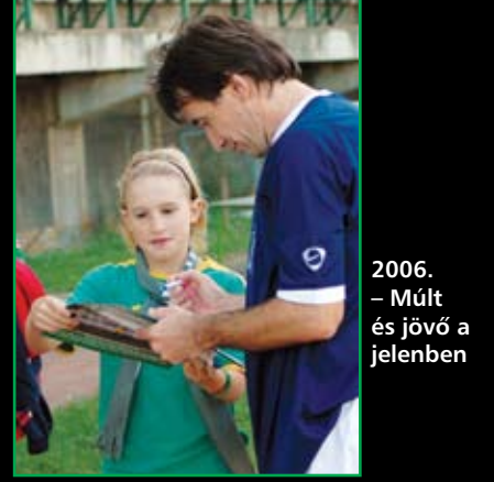
2006. – Múlt és jövő a jelenben