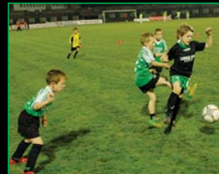
Lurkó csata az NB II-es bajnoki mérkőzés szünetében. Bemutatja a 2000-es korosztály