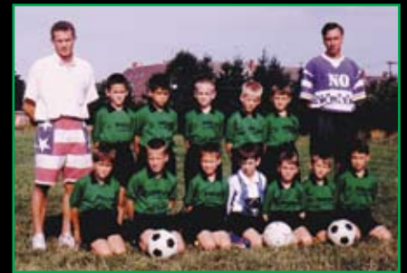
Így kezdődött... 10 évvel ezelőtt az első lurkós torna hazai csapata a Vas Megyei Iparszövetség tulajdonában lévő Farkas Károly utcai Arborétum Sportcentrumban