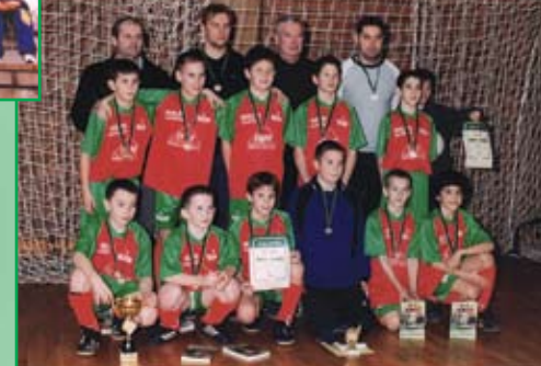
A '92-es korosztály a Papp Lajos emléktornán a Haladás Sportcsarnokban

Az első bemutatkozásra 1996 szeptemberében Zánkán került sor. Először december elsején Budapesten a Labdarúgás Világnapja alkalmából megrendezett programon mutatkozott be Lurkó UFC néven az egyesület.