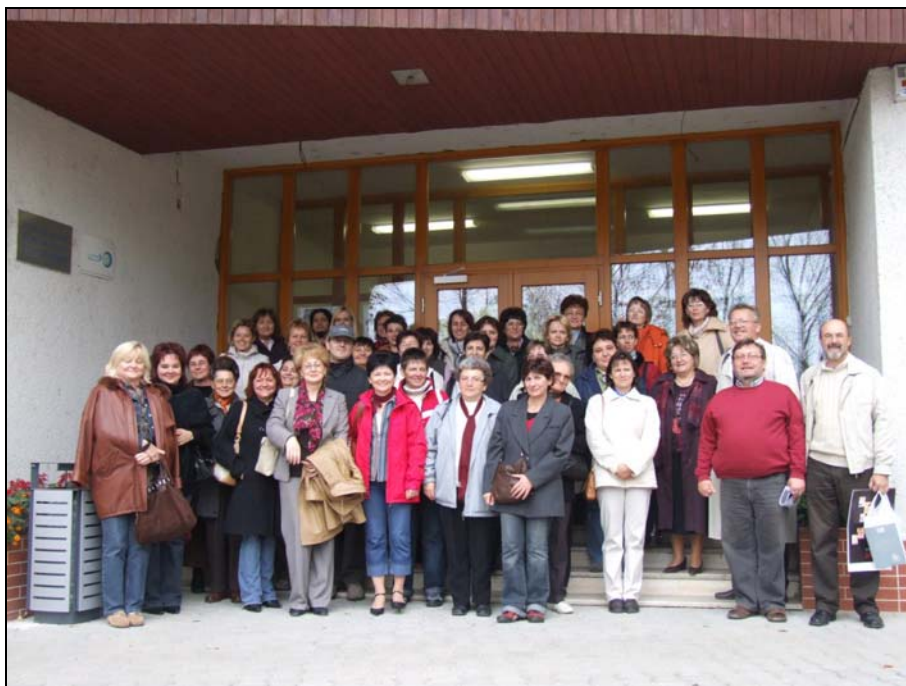
A kirándulás résztvevői Somorján, a Zalabai Zsigmond Városi Könyvtár és a Fórum Intézet bejáratánál