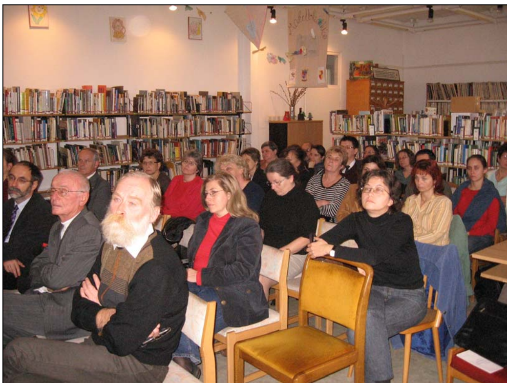
A Zalai Közgyűjteményi Napok közönsége