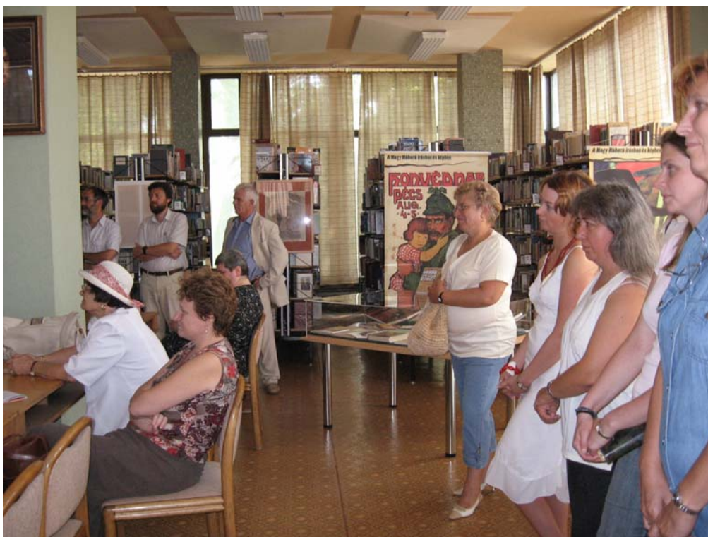
A nagy háború írásban és képen” nevet viselő vándorkiállítás augusztus 28. és szeptember 10. között Zalaegerszegen a Deák Ferenc Megyei Könyvtárban is sok érdeklődőt vonzott.