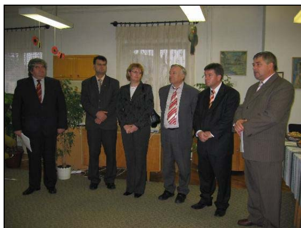
A könyvtáravató egy pillanata