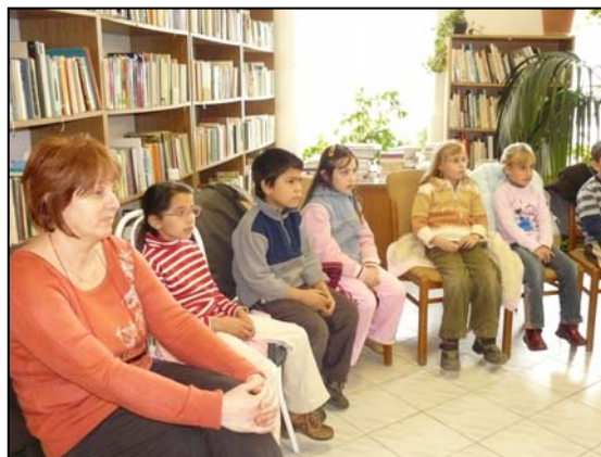
Könyvtári foglalkozás Óhídon és Sümegcsehiben