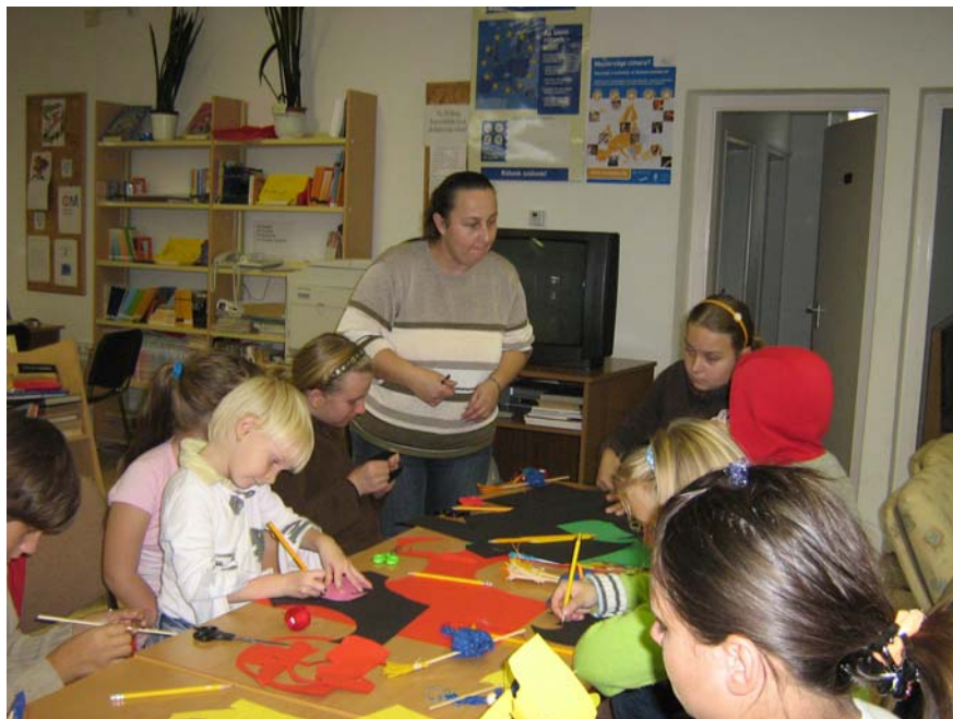
Játszóház a gelsei könyvtárban