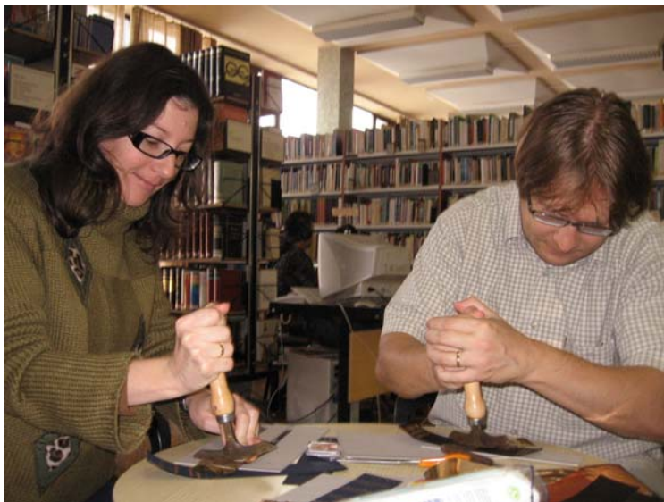
Az aranyozás technikája sok érdeklődőt vonzott a Könyves Vasárnapon