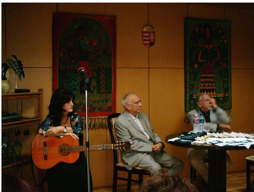
A nagykapornaki irodalmi est fellépői

2008. október 14-én író-olvasó találkozóra került sor Baranyi Ferenc Kossuth-díjas költővel Nagykapornakon.