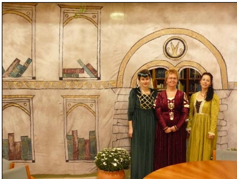
Keszthelyi könyvtárosok, mint a királyi kancellária tagjai