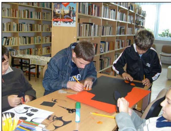
Pillanatkép a foglalkozásról

A Könyves Vasárnapon a mi intézményünk is nyitva tartott. Erre az alkalomra játszóházat is szerveztünk „Mesehősök papírból” címmel, Varjú Jancsit és Sün Balázst készíthettek a gyermekek. Az előző évhez képest sikeres volt a program, főleg azért, mert néhány felnőtt is betévedt.