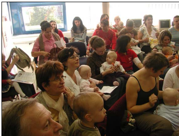
Babák és mamák a könyvtárban

Az előadás után került sor a fotópályázat „díjkiosztására”. Minden, a fotópályázaton résztvevő baba ajándékot kapott, az első három helyezett külön könyvjutalmat is.