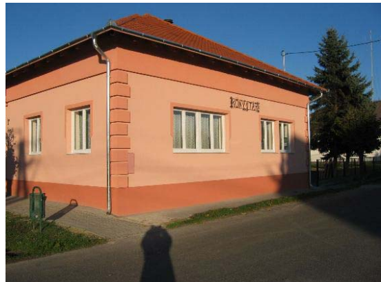
Ilyen volt... ilyen lett