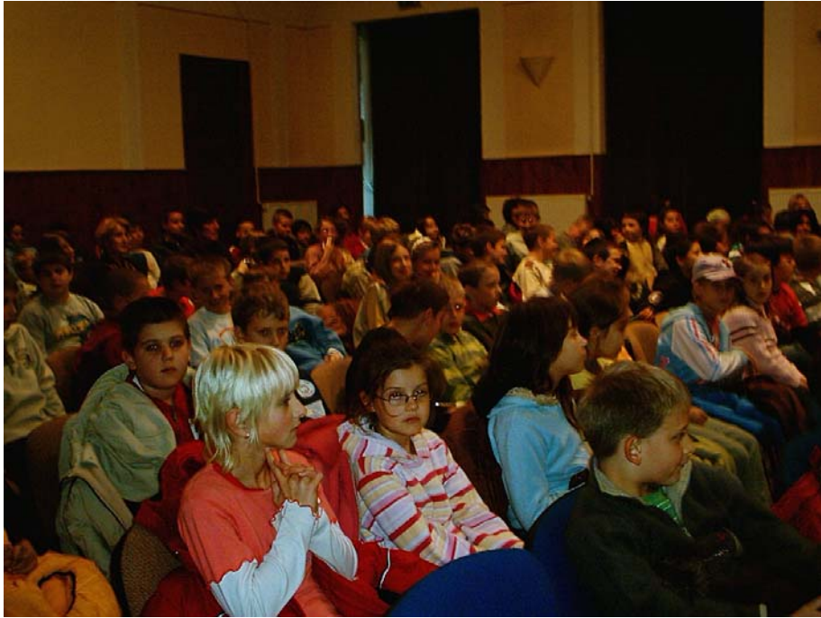
A Gellénházán tartott író-olvasó találkozó közönsége