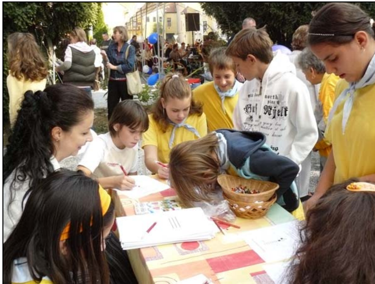
A gyerekek totót töltenek ki a könyvtár udvarán