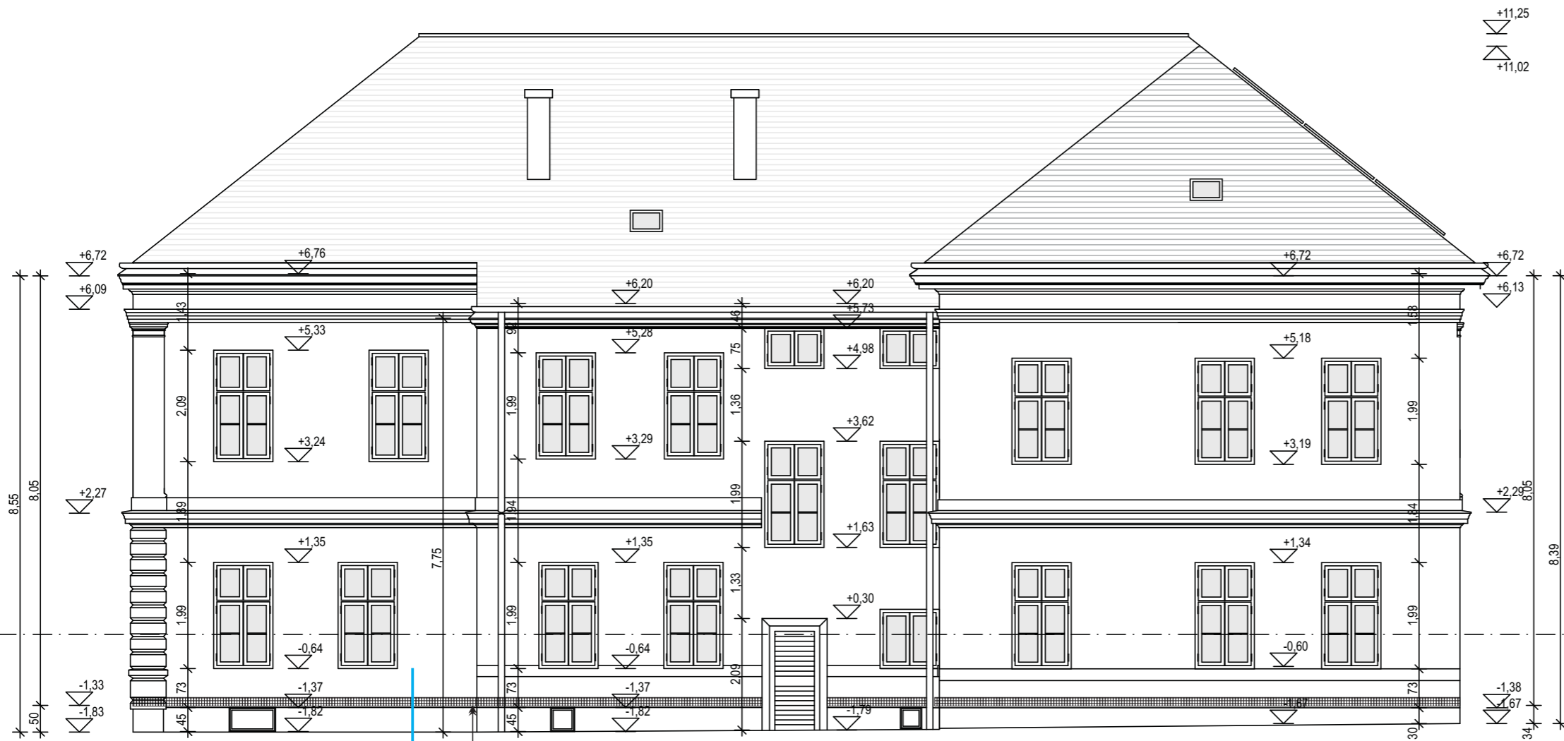
R-2 → Reversion hálózsonda a műkö lábazat felett a vakolati rétegek alatt elhelyezve