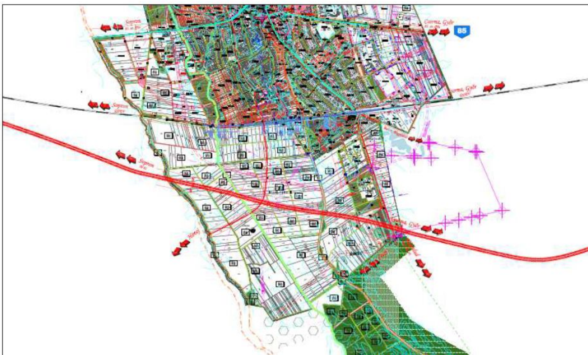
Kivonat a hatályos szabályozási tervből (Talent-Plan Kft, 2014)