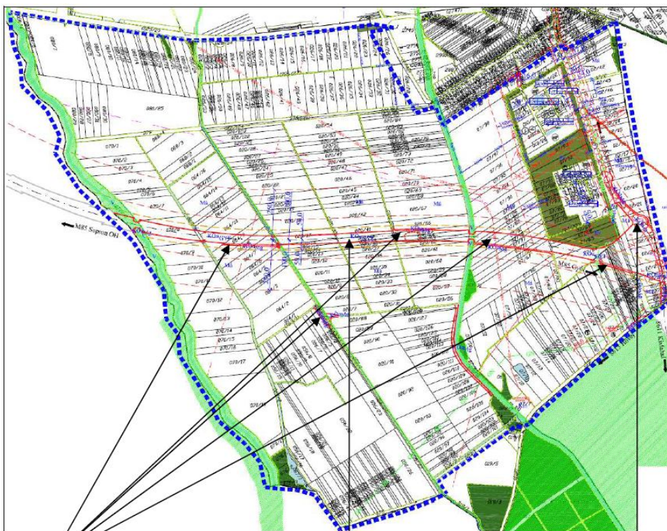
Kivonat a módosított szabályozási tervből