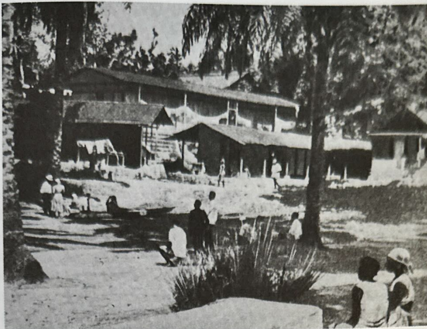
Az új kórház Lambarénében

Kórház az őserdőben Lambaréne – Schweitzer munkahelye – az Ogowe folyó partján van. Ez a folyó kb. 1200 kilométer hosszú, párhuzamos a Kongóval. Az utolsó 200 kilométeren számtalan mellékágra szakadva (delta) a Lopez-foknál ömlik az Atlanti-óceánba. Víz,