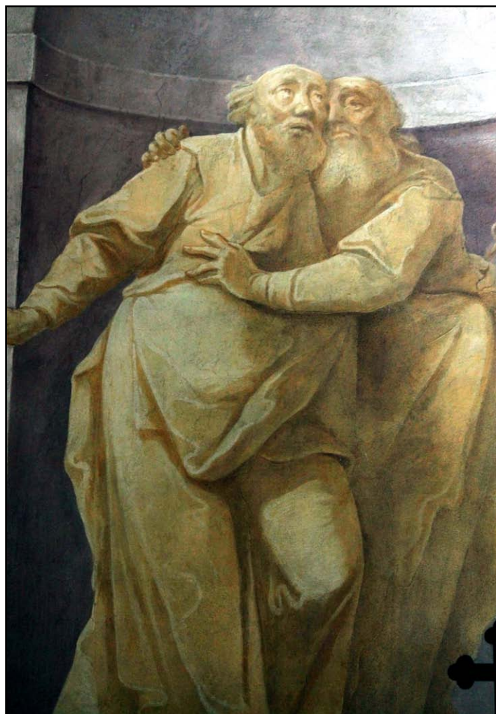
Szent Péter és Pál apostol freskója a Mária Magdolna templomban

„Péter és Pál (tudjuk) nyárban | Összeférnek a nap-tárban” – ezekkel a szavakkal kezdi Arany János a sokak által kedvelt Fülemile-történetet. S valóban a két apostol – az első és a „tizenharmadik” – neve szinte összeforrt a közös ünnep kapcsán. A hagyomány szerint ugyanaznap, június 29-én szenvedtek vértanúságot, bár nem azonos évben. Krisztus elkötelezett követése és a vértanúság valóban összehozta őket, a két apostol életútja természete és céljai azonban nagyon különböztek.