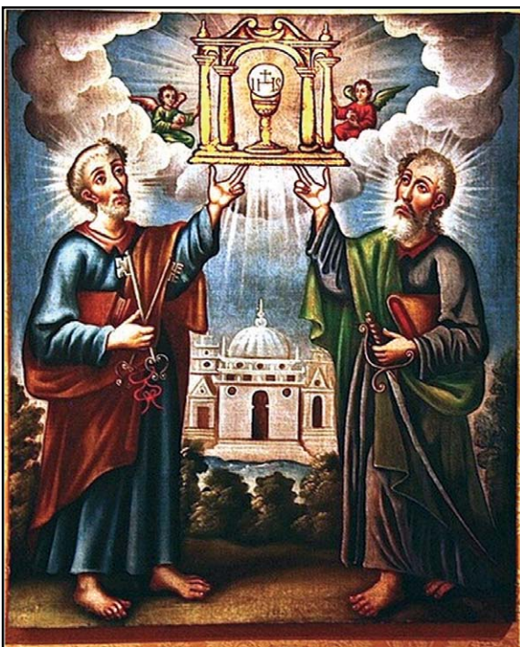
Az Oltáriszentség valamint Szent Péter és Szent Pál

A szentáldozás, feltéve, ha méltó módon történik, óriási kegyelemforrás. Amikor legközelebb szentáldozáshoz járulunk, gondoljunk arra, hogy Jézussal válunk eggyé. Egy apró gyakorlati megjegyzés, hogy ezért nem kell a szentáldozás után térdet sem hajtani: hiszen Jézus bennünk van, mi hordozzuk őt! Ha pedig Jézussal egyesülünk, akkor a halál sem vesz erőt rajtunk, hiszen, ahogy Szent Pál írja: ha meghalunk vele, vele együtt élni is fogunk” (2Tim 2,11).