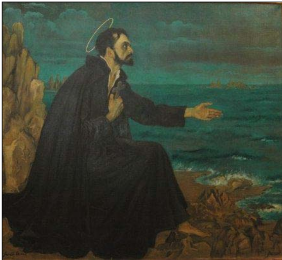
Xavéri Szent Ferenc

Ahogy már említettem, a szeretet továbbadása a lényeg, nem megtérítenünk kell az embereket, hanem szeretni, a többi a Szentlélek dolga. Hiszem, hogy a megtérés kegyelemként érkezik majd Istentől! Kíváncsivá kell tennünk az embereket a keresztény életre, hiteles tanúságot tenni hitünkről. Azt gondolom, hogy a Városmisszió Istenre mutat rá, és közösségeink megújulásához is lendületet ad.