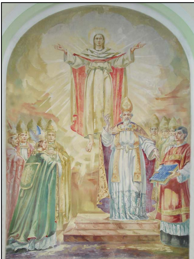
A níceai zsinat ábrázolása a fertőszentmiklósi templom főoltárképén

A zsinat lezárultával azonban a viták nem csitultak el. Bár Áriusz rövidesen meghalt, követői, az ariánusok tovább hangoztatták tanait. Ők álltak elő a Fiú személyével kapcsolatban a hasonlólényegű (homoiúsziosz) megfogalmazással. Itt tűnik fel az a bizonyos i betű. E kifejezésnek a hasonlósága révén próbálták elfogadtatni nézeteiket. Gyakran támogatta őket az ingadozó császári politika, az igaz hit bajnokát Szent Atanáz alexandriai pátriárkát például, aki a zsinaton még diakónusként vett részt, Konstantin és utódai alatt ötször száműzték. Dan Brown állításával ellentétben éppen az ariánus felfogás, mely Jézus személyéből egy közvetítő lényt formált, volt jobban összehangolható a Legfőbb Lény kultusza felé elmozduló akkori pogány felfogással, és nem a katolikus hit.