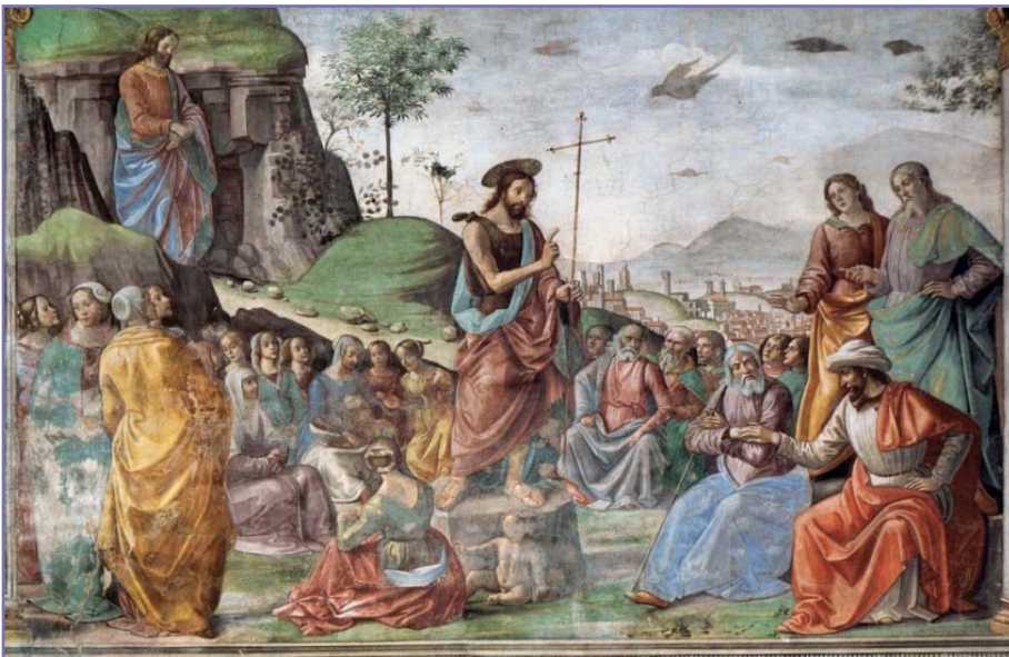
Domenico Ghirlandaio - Keresztelő Szent János prédikál

A második, hogy nem véd meg a depressziótól, ha csak környezeti hatásoknak tudunk örülni. Hogy eljön-e a gyerek és az unoka hétvégén, az az ő döntése, hogy kapok-e támogatást, az az önkormányzat döntése, hogy esik-e a hó, azt a természet törvénye szabja meg. Hogy akkor is folytatom a megmaradt képességeim kihasználását, amikor az már nem a régi, az az én saját döntésem. Az igazi öröm belülről