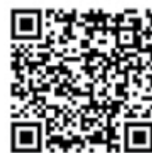
HAZA • FELÉD