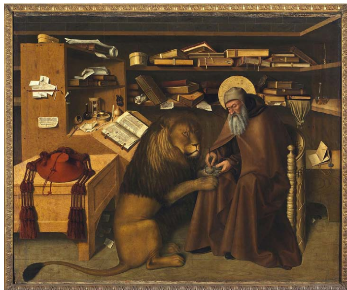
Colantonio: Szent Jeromos dolgozószobájában; oltárkép; 1445 körül; Capodimonte Nemzeti Múzeum

Egy alkalommal, amíg a szamár legelészett, az oroszlán mély álomba merült. Kalmárok jöttek arra tevéikkel, akik úgy látták, hogy a szamár egyedül van, s azon nyomban elhajtották. Mikor az oroszlán felébredt, és nem találta társát,