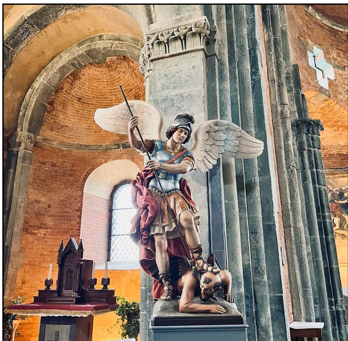
Szent Mihály - Sacra di San Michele

Az egyházi ünnep a 6. század óta szeptember 29. az arkangyal megjelenésének, a sárkány (Jel 7,12), azaz a Sátán feletti győzelem napja.