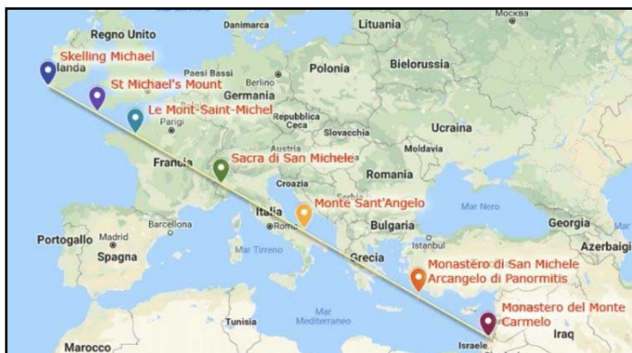
Szent Mihály kegyhelyek

A bizánci művészetből átvett attribútum a gömb is, amellyel az arkangyalokat ábrázolták, ez azonban inkább a festészetre volt jellemző, nálunk kevés példa van rá.