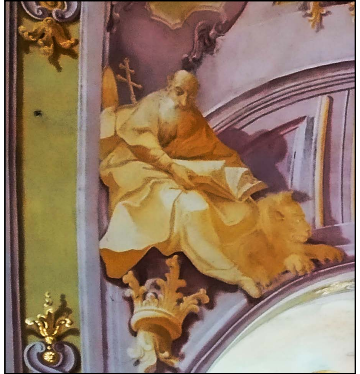
Szent Jeromos - egyházdoktor

Még ifjan Rómába ment, ahol nem vetette meg a nagyváros által kínált szórakozási lehetőségeket sem, de számára Róma mindig a vértanúk városa maradt, rendszeresen látogatta a katakombákat is.: Tanulmányainak befejezése után 366-ban Liberius pápa keresztelte meg, majd szerzetesi és papi közösségekhez csatlakozott. Ekkor kezdett foglalkozni