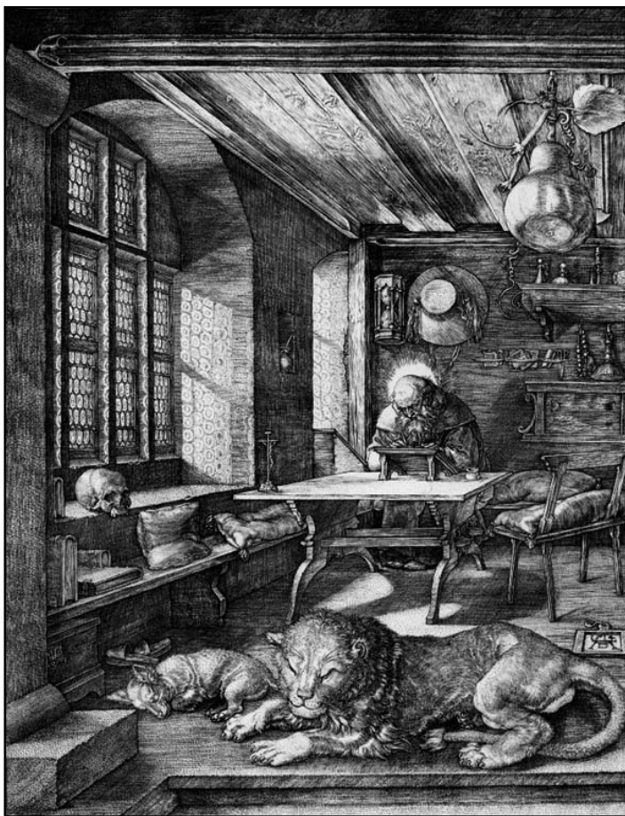
Albrecht Dürer: Szent Jeromos a cellájában; rézmetszet; 1514

re, hátha találnak valami bizonyítékot, de semmit sem leltek.