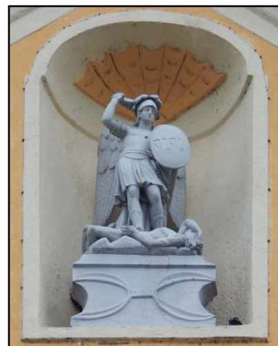
Szent Mihály arkangyal szobra a Mária Magdolna templom homlokzatán